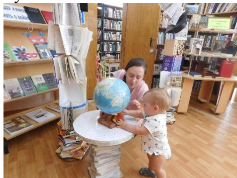
Июль 2019. Я познаю мир!

Российского государства», уже посещает библиотеку с повзрослевшим сыном. И пусть внимание малыша