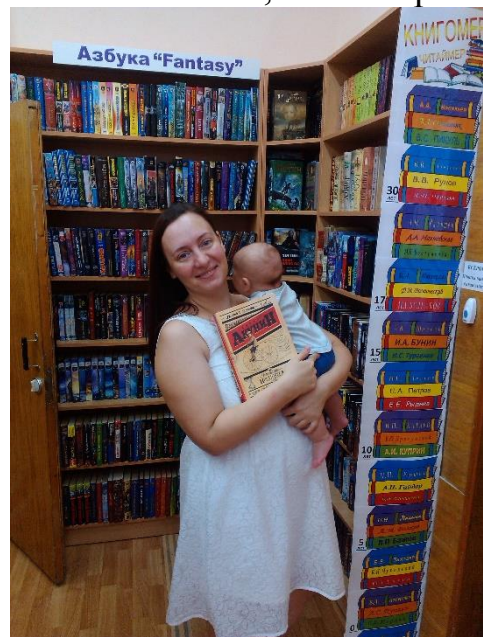
Первое посещение библиотеки. Август 2018 года.

Библиотекари проявляют искреннее участие к своим читателям, особенно трогательно относятся они к молодым мамам, посещающими с малышами библиотеку. Ведь это так важно соблюдать баланс между саморазвитием и воспитанием ребёнка и, самое главное, не терять